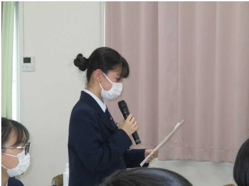
生徒代表お礼の言葉