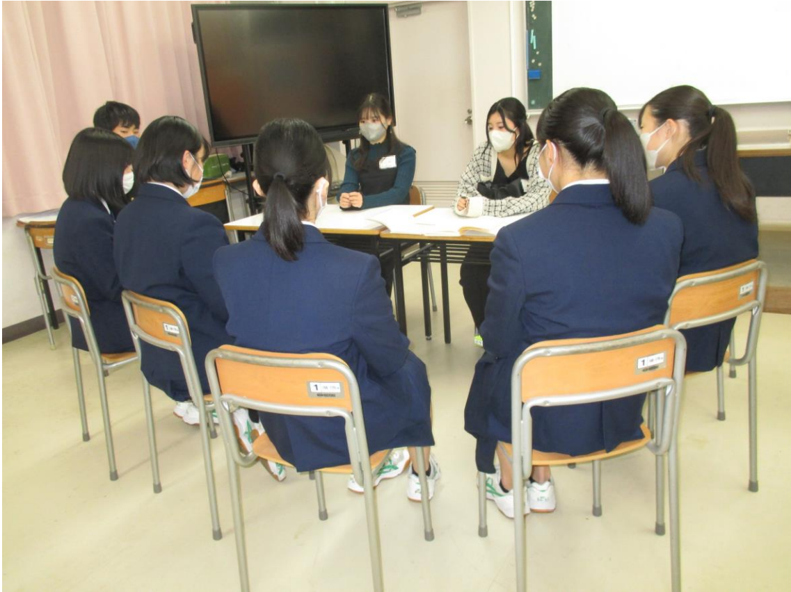
メンバーチェンジ