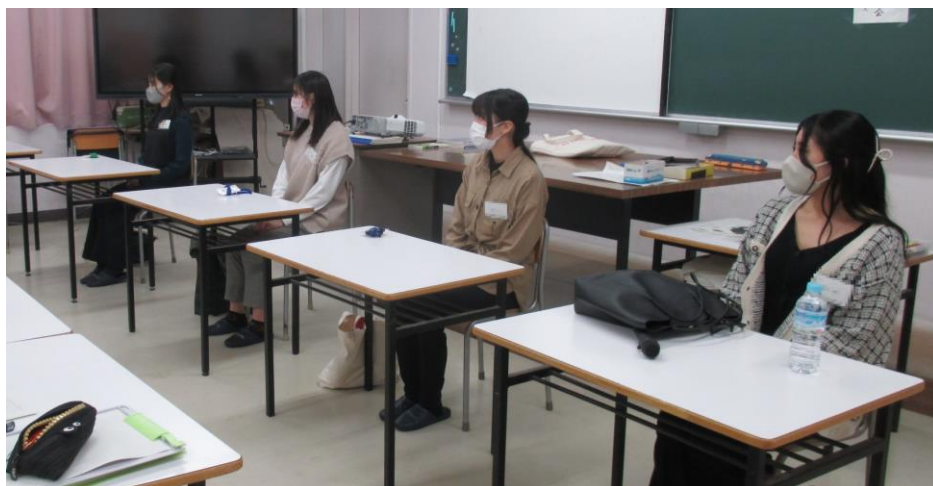
卒業生（第7期生）の紹介

会の終了後も一部の生徒は先輩方を捕まえて遅くまで突っ込んだ内容を聞いていたようです。