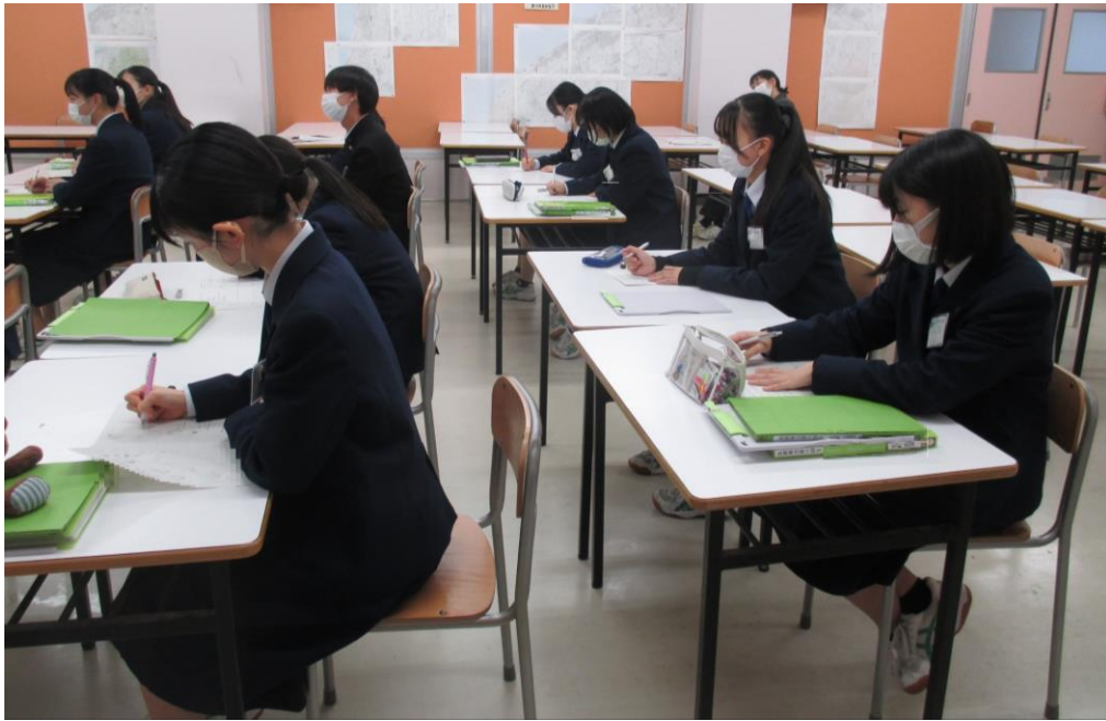
第2部 フリー質問タイム 2班に分かれて